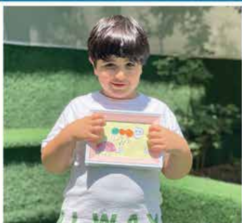
کمپین نقاشی - مرداد ماه ۱۴۰۲