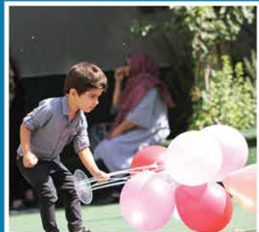
روز جهانی عکاسی - مرداد ماه ۱۴۰۱