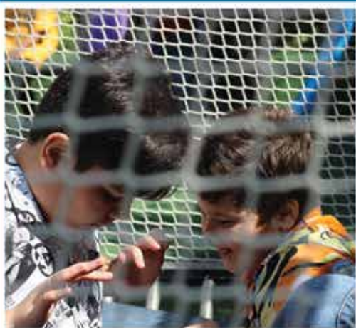
روز جهانی عکاسی - مرداد ماه ۱۴۰۱