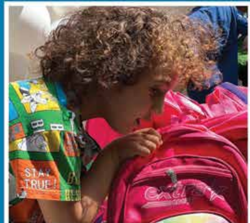
جشن مهر - مهر ماه ۱۴۰۱