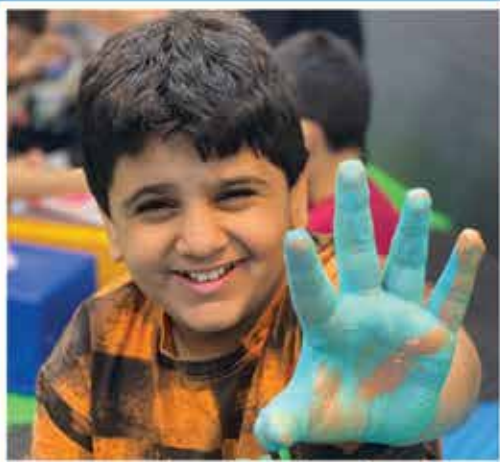
کمپ تابستانی - تابستان ۱۴۰۲