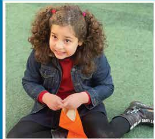
جشن یلدا - دی ماه ۱۴۰۱